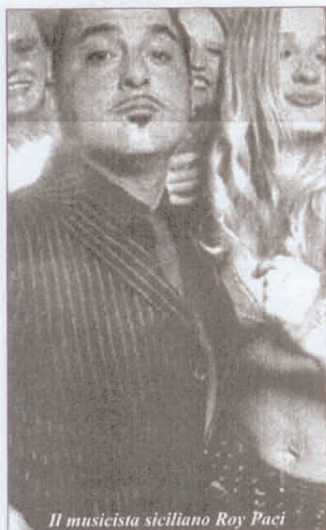
Il musicista siciliano Roy Paci